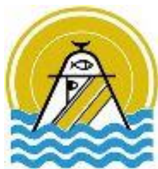
Mairie de Houmt-Souk