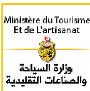
Ministère du Tourisme et de l'Artisanat

L'association des Amis de la Médina s'est entourée de nombreux partenaires, acteurs incontournables dans le soutien et la promotion de l'art et de la culture, pour organiser les rencontres artistiques DjerbaDREAM.