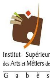
Institut Supérieur des Arts et Métiers de G a b è s