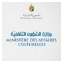
Ministère des Affaires Culturelles